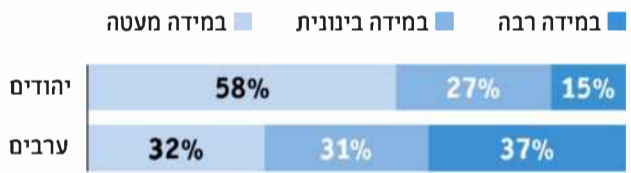
רגשות כלפי הקבוצה האחרת n=1 כלל לא; 6 = במידה רבה