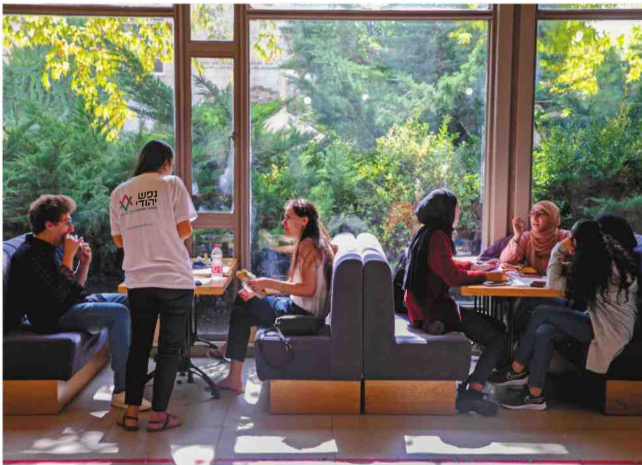
סטודנטים בעברית, ב־2019. "זה מביך להתערבב", אומרת ראש יחידת הגיוון באוניברסיטה למצולמים אין קשר לכתבה